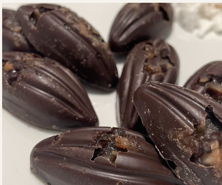
FOTO: BOMBOM DE CHOCOLATE PÉ DE MOLEQUE