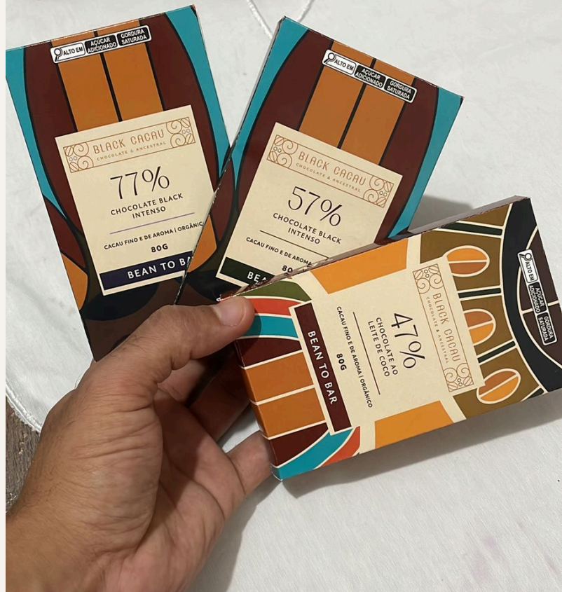
FOTO: BARRA DE CHOCOLATE BLACK CACAU