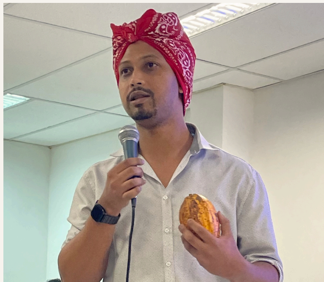
FOTO: PALESTRA SOBRE CONSUMO - UFRJ

Levamos para universidades e eventos um debate que raramente ocupa esses espaços: raça, reconhecimento e desigualdade na cadeia produtiva do cacau. Transformamos pesquisa em diálogo.