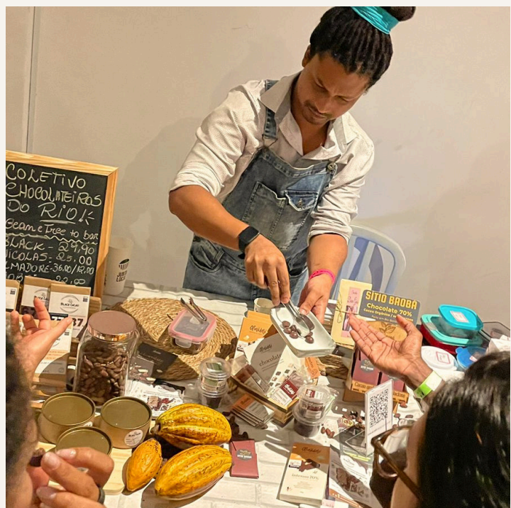
FOTO: EVENTO COM DEGUSTAÇÃO DE CHOCOLATES

Nossa revista digital reúne mensalmente histórias, pesquisas, territórios, entrevistas e curadorias construídas a partir da cadeia produtiva do cacau brasileiro.