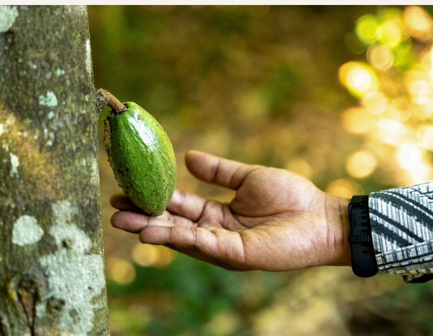
FOTO: CACAU EM FASE DE CRESCIMENTO - SÍTIO BAOBÁ - RJ