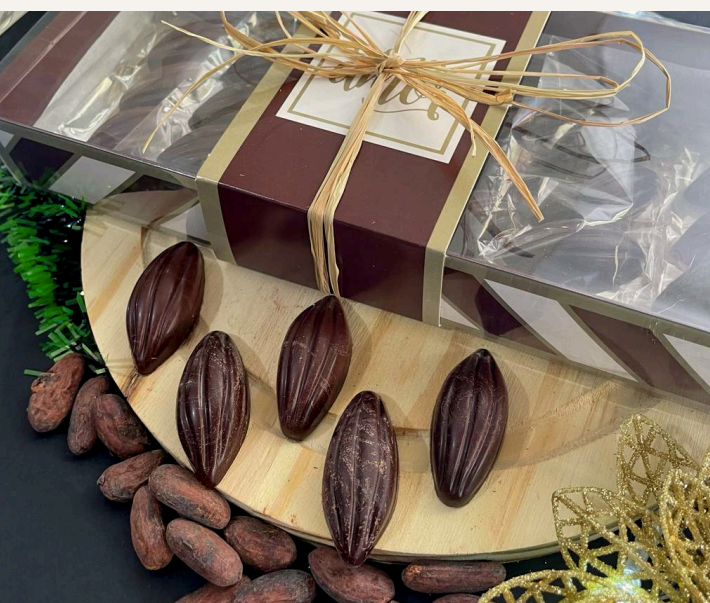
FOTO: CAIXA DE BOMBOM PERSONALIZADA

Desenvolvemos chocolates, brindes e experiências personalizadas para empresas, instituições, eventos e projetos especiais.