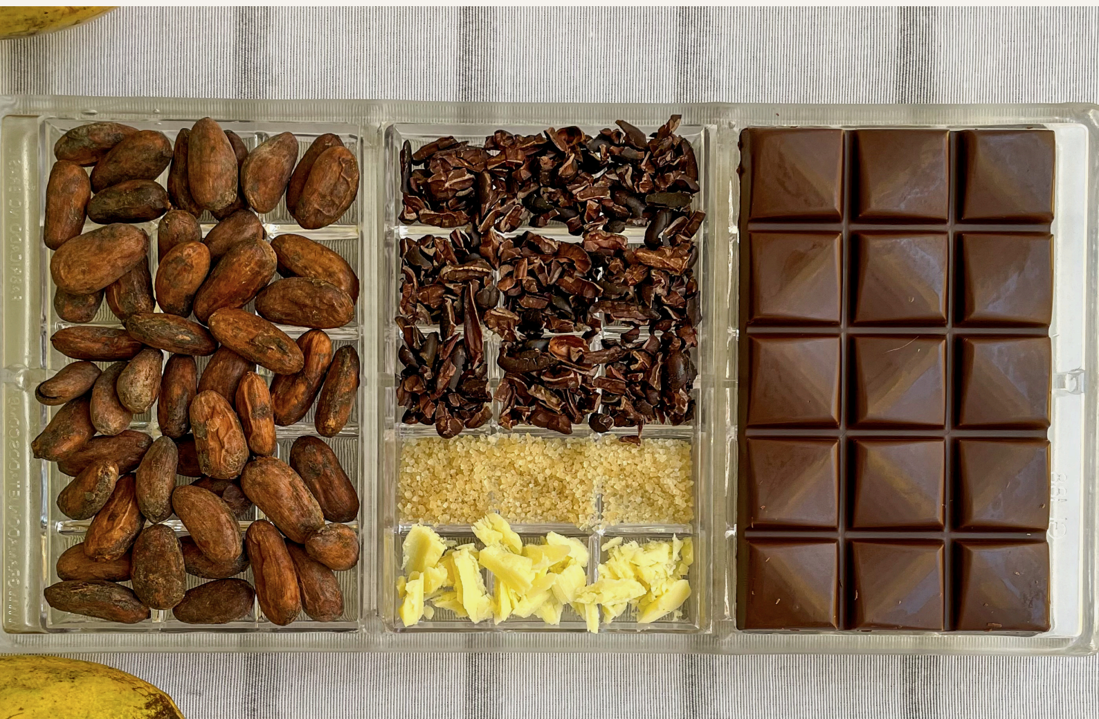
FOTO: INGREDIENTES UTILIZADOS E NOSSA BARRA DE CHOCOLATE

Cada seleção sazonal reúne produtos, narrativas e experiências que ajudam a ampliar a circulação de valor dentro da cadeia do cacau brasileiro.