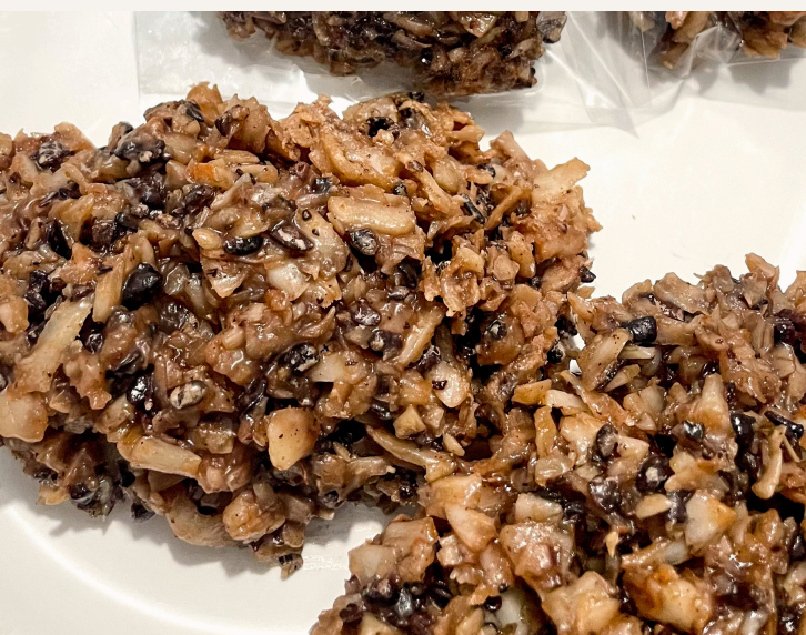
FOTO: CHOCADA DE CACAU - EDIÇÃO LIMITADA DE 2024